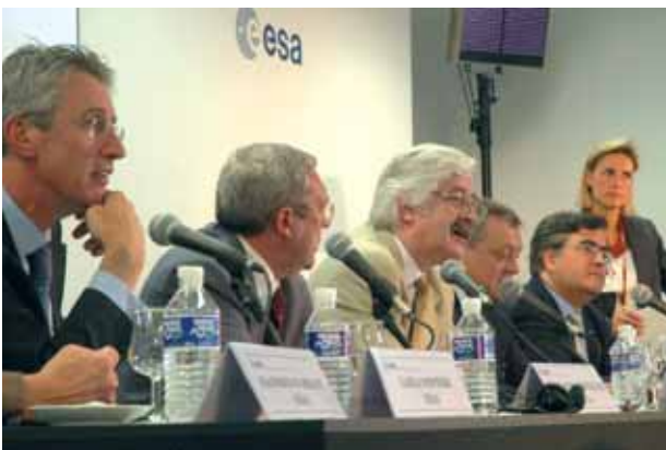
Ceremonia de inauguración

La ingeniería civil de esta instalación es impresionante: El plato móvil de la antena tiene un diámetro de 35 metros; la estructura completa mide 40 m de altura; y,