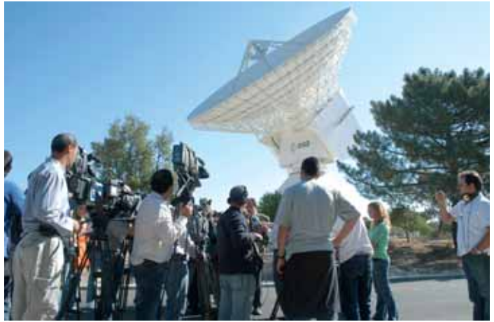
Medios de comunicación ante la nueva antena

Hacia finales de octubre se abre una ventana de lanzamiento para la Venus Express. Un cohete Soyuz la colocará en una órbita de aparcamiento en torno a la Tierra. Una vez ahí, la etapa superior del cohete, Fregat, enviará la